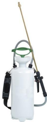
Spruzzatori a bassa pressione con risciacquo ad acqua