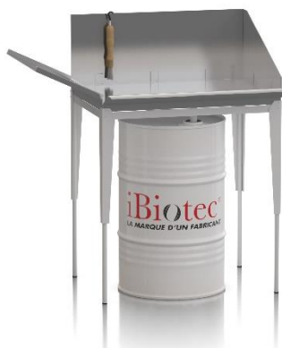
Vasche con solventi