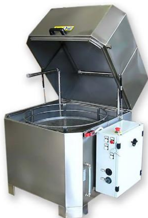
Cestello rotante o traslante