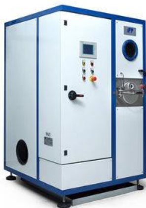
Macchine di lavaggio A3

iBiotec® Tec Industries®Service Z.I La Massane - 13210 Saint-Rémy de Provence – France Tél. +33(0)4 90 92 74 70 – Fax. +33 (0)4 90 92 32 32 www.ibiotec.fr