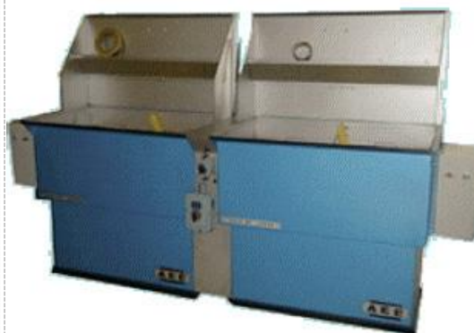
Vasche per immersione a caldo e a freddo