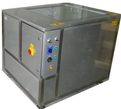
Vasche a ultrasuoni